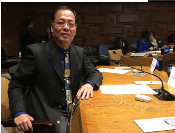
羅揚銘博士受邀赴聯合國演講前剪影

羅揚銘博士在美國馬里蘭大學食品科學與營養學系擔任多年教授，曾經主持多項研究及教育推廣的計畫，並擔任研究所主任的職務。懷著具體發揮影響的志願，他毅然放棄教職，走出象牙塔，投入促進世界食品安全的工作。他走遍世界，教農民正確施肥，教食品工廠安全加工，教政府官員制定完善政策、落實管理。他所創辦的公司是獲得國際食品安全品質總部(SQFI)認可的全球培訓中心之一，致力於協助開發中國家發展農業及食品科學。羅博士同時也是「食品科學與營養」國際科學期刊的總主編。